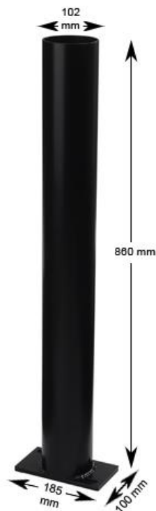
Figur 1 Art.no: 1090178