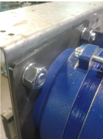
VISTA POSTERIORE - BACK VIEW