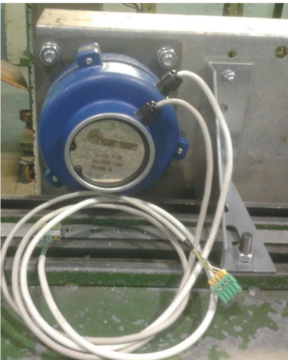
VISTA POSTERIORE - BACK VIEW