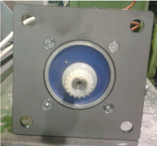
PIASTRA SUPPORTO NUOVO MOTORE